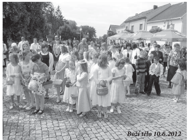
Boží tělo 10.6.2012