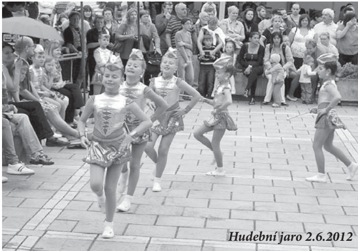
Hudební jaro 2.6.2012