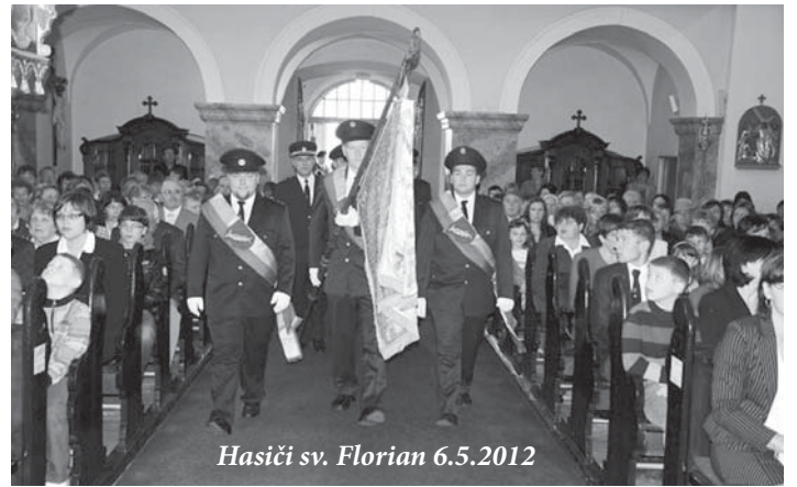
Hasiči sv. Florian 6.5.2012