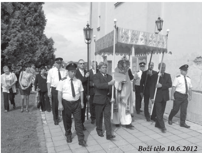
Boží tělo 10.6.2012