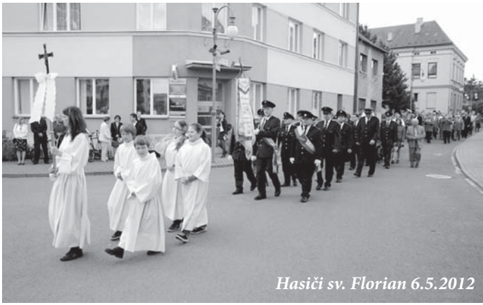
Hasiči sv. Florian 6.5.2012