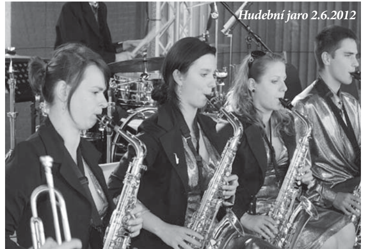
Hudební jaro 2.6.2012