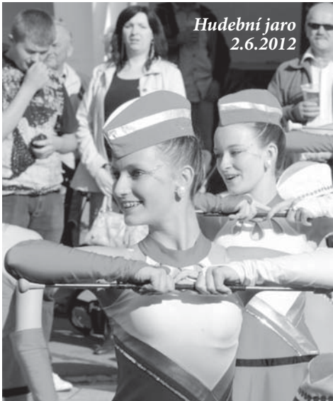
Hudební jaro 2.6.2012