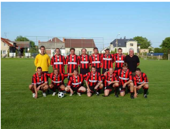
Obr. Hráči Slezského FC Opava