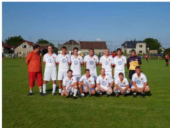
Obr. Hráči domácí TJ Sokol Sudice