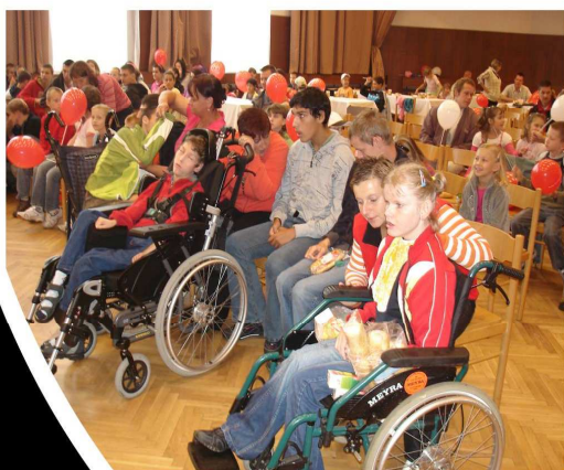
Tyto děti jsou vděčnými diváky