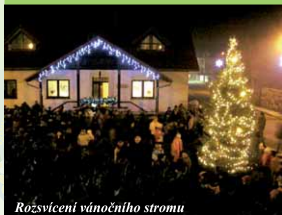
Rozsvícení vánočního stromu

Člověk je tvor soutěživý a když má navíc nějakého koníčka, který jej baví, má touhu předvést výsledky své práce a porovnat ji s ostatními. Pokud tedy máte tuto potřebu seberealizace a chuť si zasoutěžit, vezměte si fotoaparát a vyjděte do přírody.