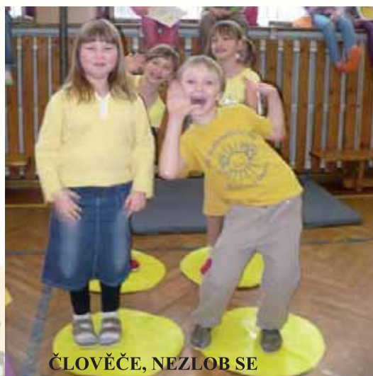
ČLOVĚČE, NEZLOB SE