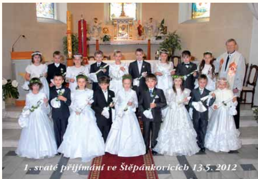
1. svaté přijímání ve Štěpánkovicích 13.5.2012