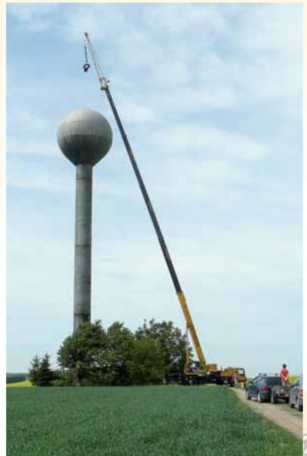
Sundávání vrchního poklopu z našeho vodojemu.