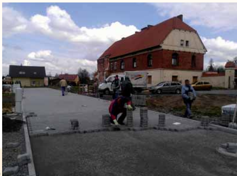
V areálu U Dvora pracovníci střediska služeb budují svépomocí novou místní komunikaci.