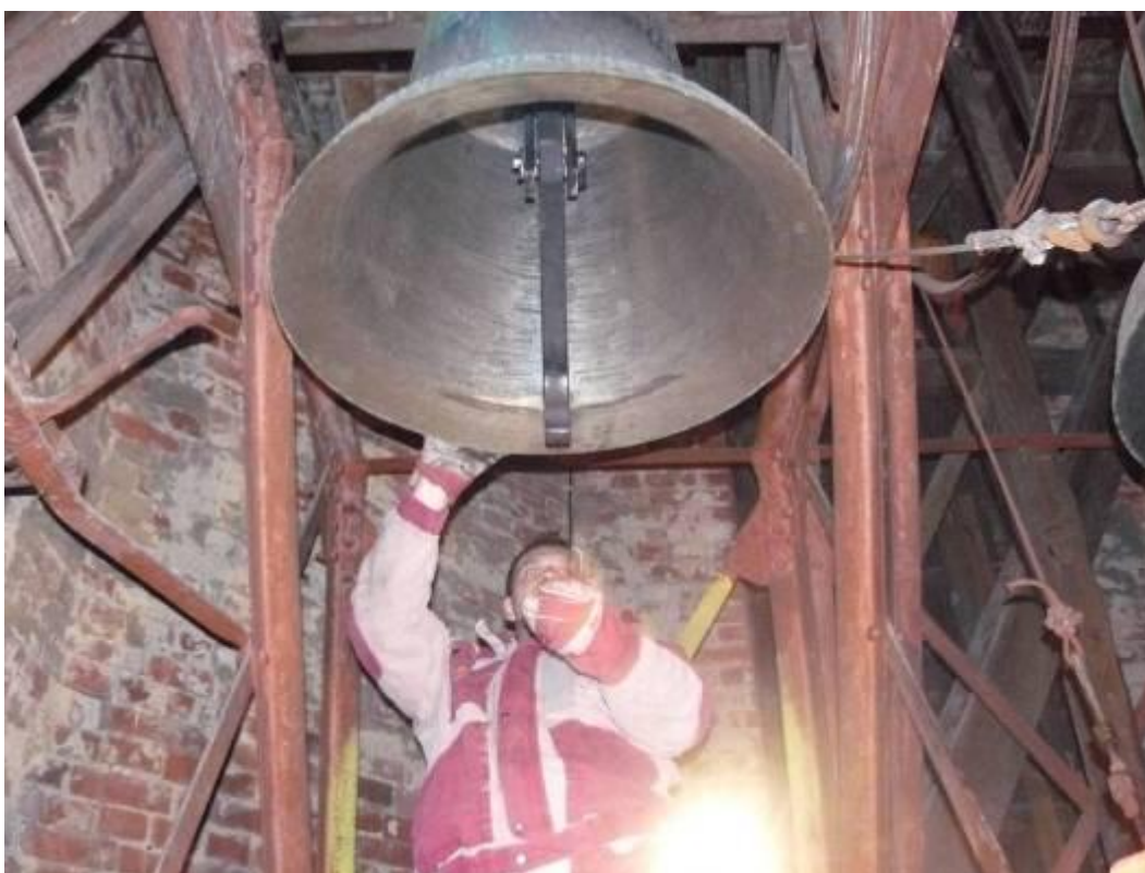
První zkušební udeření nového srdce o zvon.