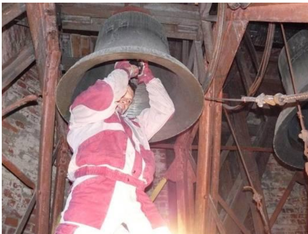
Zvon Mikuláš ještě bez srdce