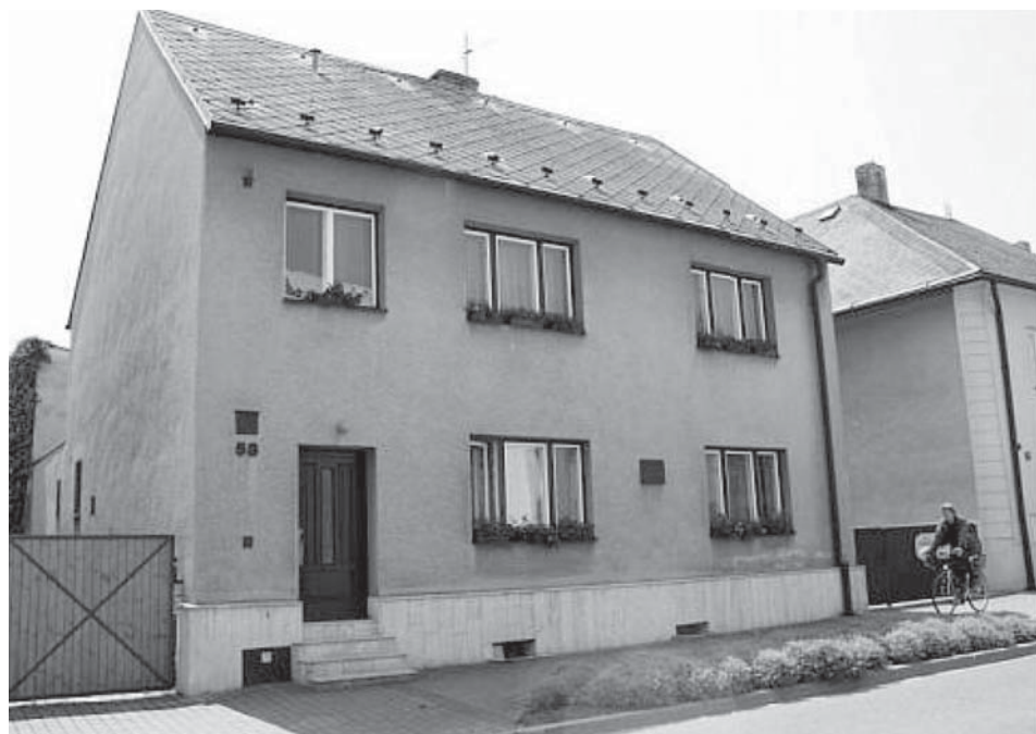
Cyprián Lelek, kněz, pedagog a vlastenec pochází z Dolního Benešova. Jeho rodný dům na náměstí stojí dosud.

Kněžské svěcení přijal v roce 1835 v Poznani a hned se vrací do Horního Slezska. Nejprve byl kaplanem na Hlubčicku, kde při kázání používal českého jazyka, aby Moravce získal pro národní uvědomění. S vervou se začíná věnovat národopisu, podařilo se mu v krátkém čase objevit čtyřicet starých moravských a polských písní.