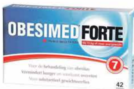
Obesimed Forte 42 kapslí