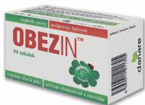
Obezín 90 kapslí

podporují hubnutí / vytváří pocit nasycenosti / snižují chuť k jídlu / udržují cholesterol v normálu