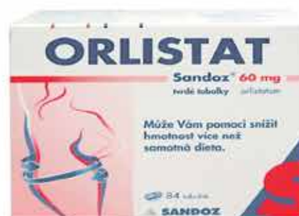
Orlistat Sandoz 60 mg por. cps. dur. 84x60 mg