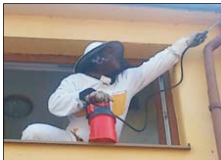
Hasič likviduje postříkem hmyz

V letošním roce přeji hasiči svým spoluobčanům opět klidný rok. Právě takový, abychom se setkávali spíše na pozici prevence, než u skutečných událostí. A protože hasiči byli celý rok hodní, dostali od Ježíška dárek. Ale o tom zase někdy příště.