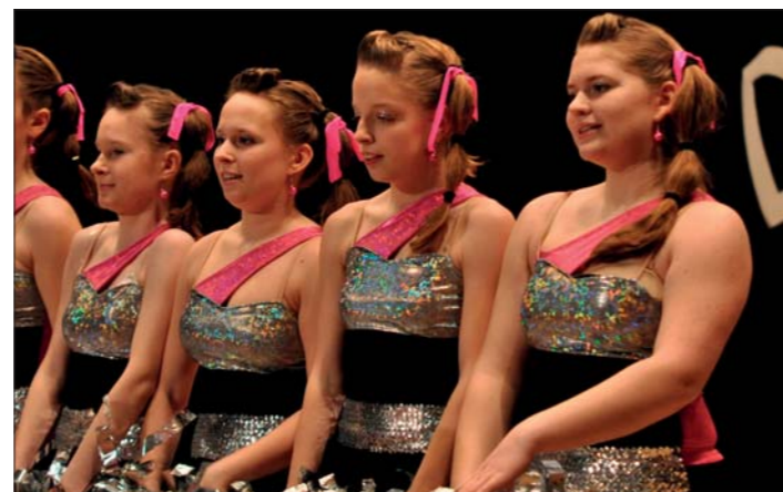
Excelent Cup - 16. 3. 2013