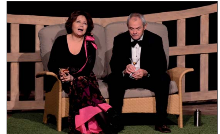
Divadlo, Rybářík královský 27. 3. 2013