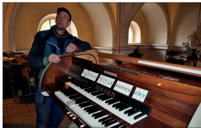
Montáž varhan - březen 2013