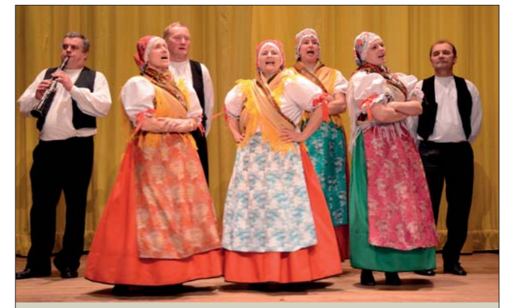
Jarní posezení seniorů 6. 4. 2013