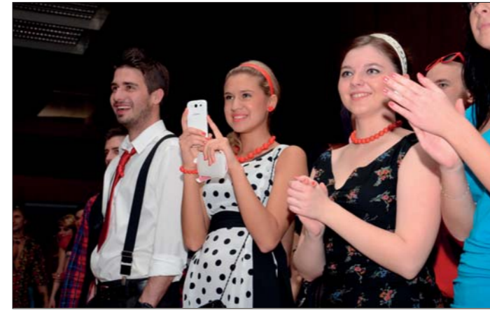
Rock a Roll ples 22. 3. 2013