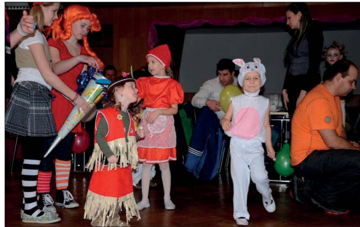
Dětský maškarní 24. 2. 2013