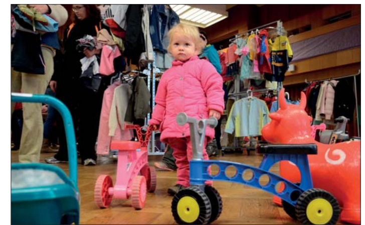
Jarní dětská burza 13. 4. 2013