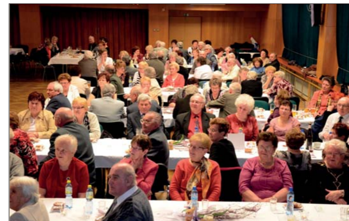
Jarní posezení seniorů 6. 4. 2013