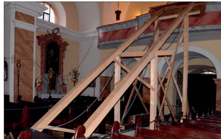
Montáž varhan - březen 2013