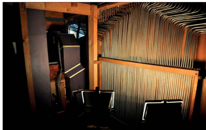
Montáž varhan - březen 2013