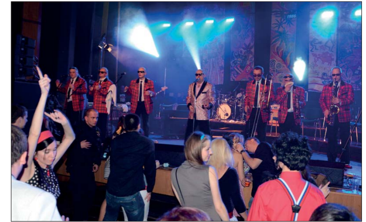
Rock a Roll ples 22. 3. 2013