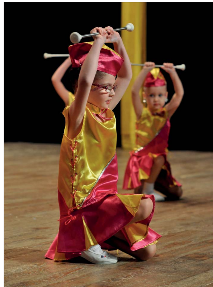
Excelent Cup - 16. 3. 2013