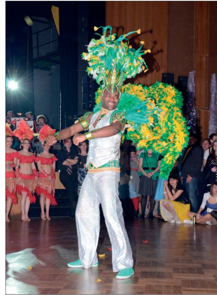
Rock a Roll ples 22. 3. 2013