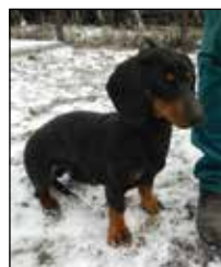
ANDY, pes, 3 roky, jezevčík, hnědý s černými skvrnami, vhodný ke starším lidem, k RD i do bytu, hodný. Nalezen 9.3.2013