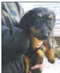
ALAN, pes, 3 roky, kříženec knírače, černohnědý, vhodný k RD nalezen 24.1.2013 v Bobrovnicích