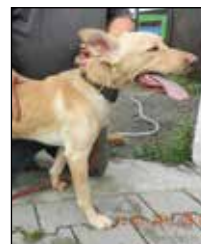
MÍŠA, pes, 1 rok, světle hnědý kříženec, temperamentní, vyžadující pohyb, vhodný k RD, nalezen 24.06.2012