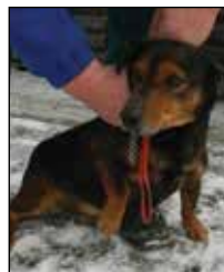
FIDO, pes, 7 let, kříženec jezevčíka, hnědý, vhodný ke starším lidem, nalezen 9.3.2013

Na požádání bude vystaveno potvrzení města o přijetí daru - o potvrzení požádáte odbor životního prostředí a komunálních služeb, paní Dedkovou, tel: 595020231.