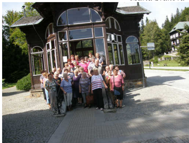
Karlova Studánka – léčivý pramen