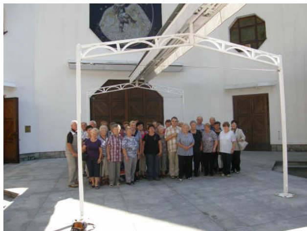
Maria Hilf – kostel Panny Marie Pomocné