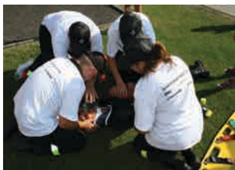
Cvičení v poskytnutí první pomoci

cvičení poskytnutí první pomoci družstva hasičů z Ratiboře a Kravař v rámci projektu „BEZPEČNOST BEZ HRANIC“. Předmětem projektu, který byl zahájen v loňském roce, je prostřednictvím spolupráce mezi městy Kravaře a polskou Ratiboří vytvořit podmínky pro vzájemné sblížení se obyvatelstva na obou stranách hranice, zejména ve spojení s problematikou poskytování první pomoci a s řešením mimořádných krizových událostí. Projekt je spolufinancován z prostředků Evropského fondu pro regionální rozvoj - z Fondu mikroprojektů v Euroregionu Silesia v rámci Operačního programu přeshraniční spolupráce Česká republika – Polská republika 2007 – 2013. Během akce byly účastníkům a veřejnosti věnovány drobné publikační a propagační materiály projektu.