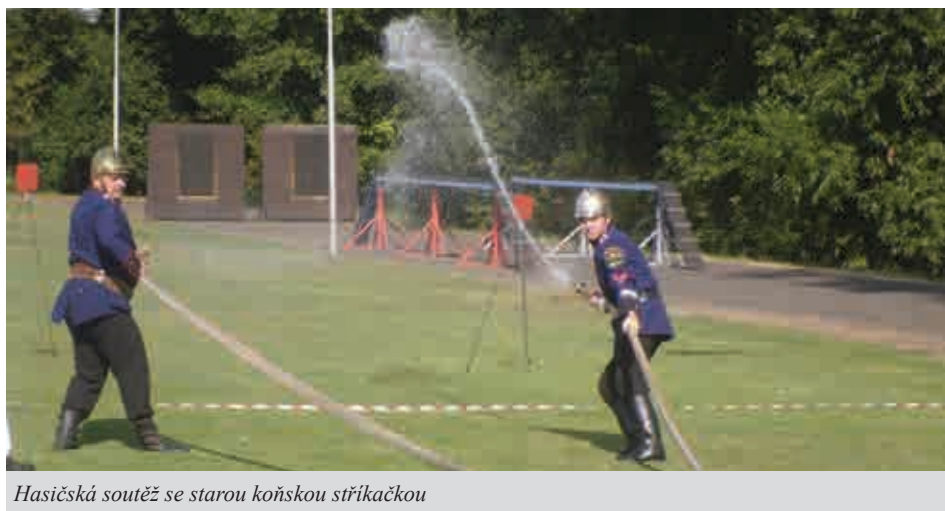
Hasičská soutěž se starou koňskou stříkačkou