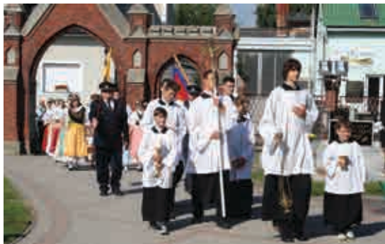
Slavnostní průvod z farního úřadu do kostela sv. Bartoloměje