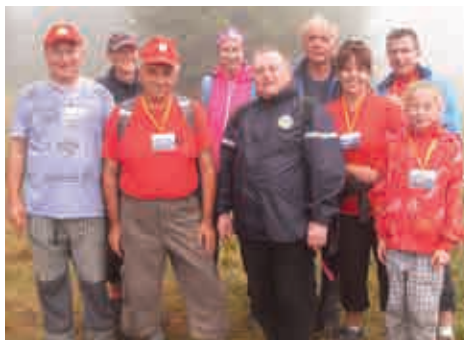
Účastníci výstupu z družební obce Lisková a z Kravaře