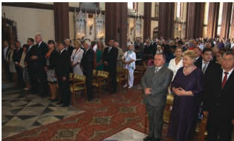
Slavnostní mše svatá v kostele sv. Bartoloměje v Kravařích