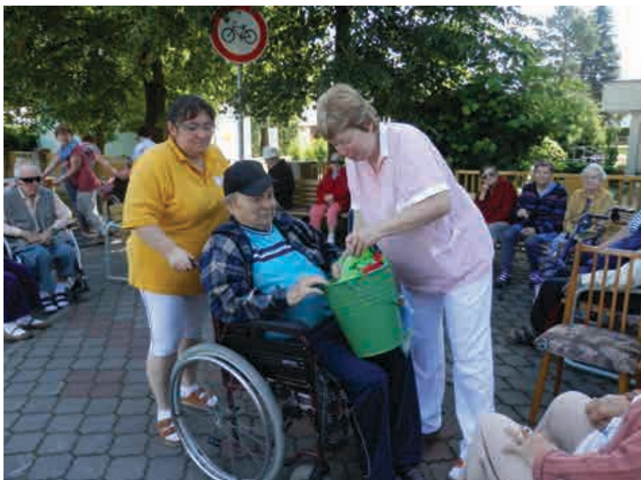
Sportovní hry v Domově pro seniory sv. Hedviky