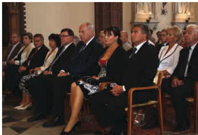
Slavnostní mše svatá v kostele sv. Bartoloměje v Kravařích