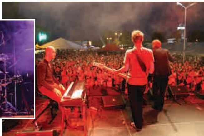
Hlavní hvězda Kutského odpustu Miro Žbirka s kapelou roztleskává publikum