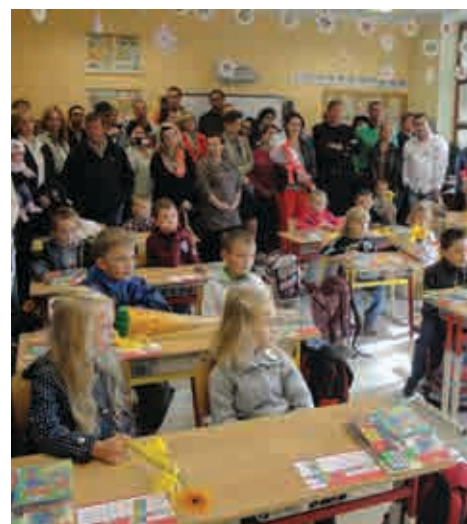
Přivítání prvňáčků v ZŠ Kravaře-Kouty