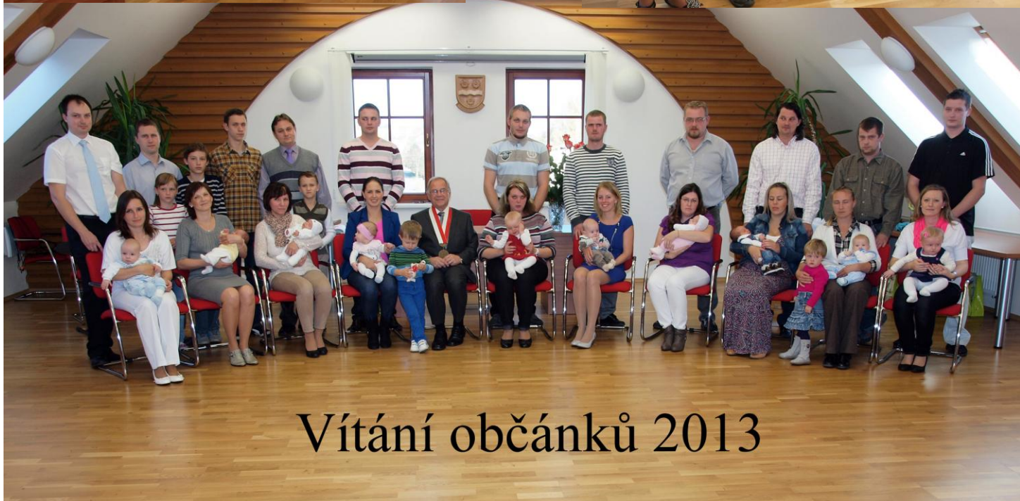
Vítání občánků 2013