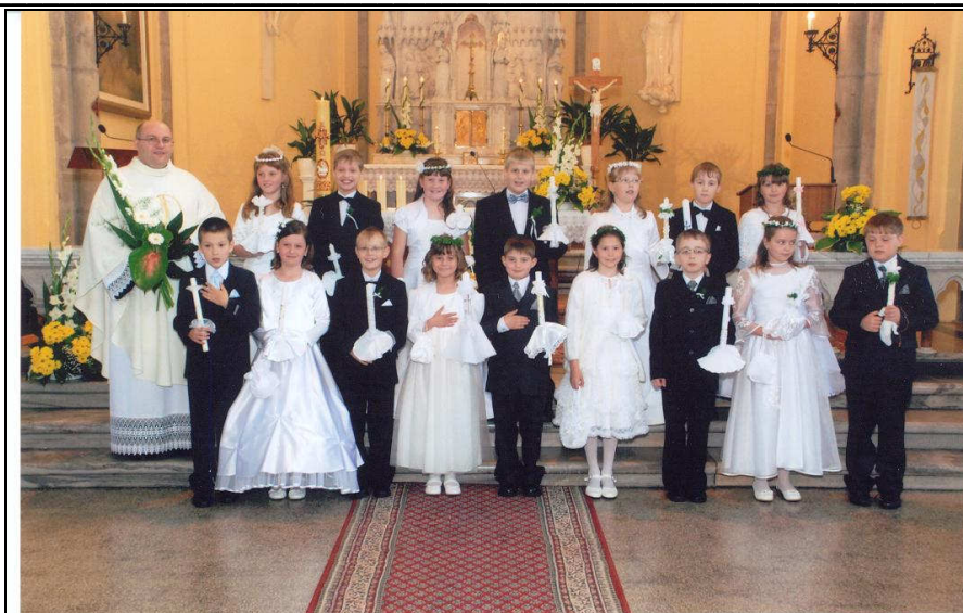
PRVNÍ SVATÉ PŘIJÍMÁNÍ SUDICE 26.5.2013

Odbor dopravy a silničního hospodářství Krajského úřadu Moravskoslezského kraje připravuje návrh jízdních řádů drážní (vlakové) dopravy na období 2013/2014. Návrhy jízdních řádů jsou také zveřejněny na webových stránkách MSK: www.kr-moravskoslezsky.cz v sekci Veřejná správa, části Doprava, části Veřejná doprava-jízdní řády, pod bodem č. 7 Návrh jízdního řádu drážní dopravy na období 2013/2014. Připomínky k návrhu jízdního řádu můžete uplatnit na obecním úřadě do 30.06.2013, následně budou předány KÚ MSK v Ostravě.