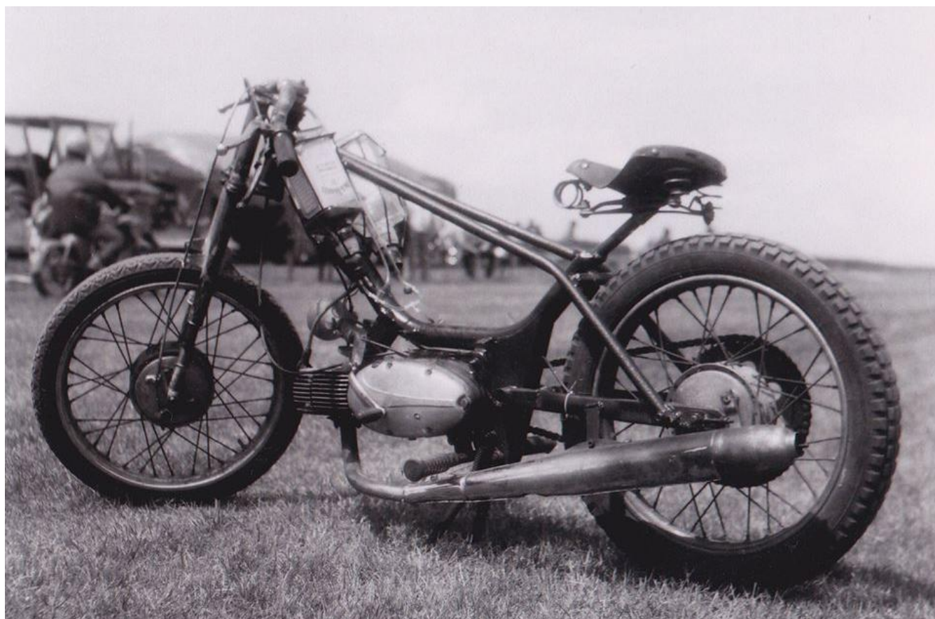
Motocykl Tomáše Plačka, se kterým si dojel pro 2. místo