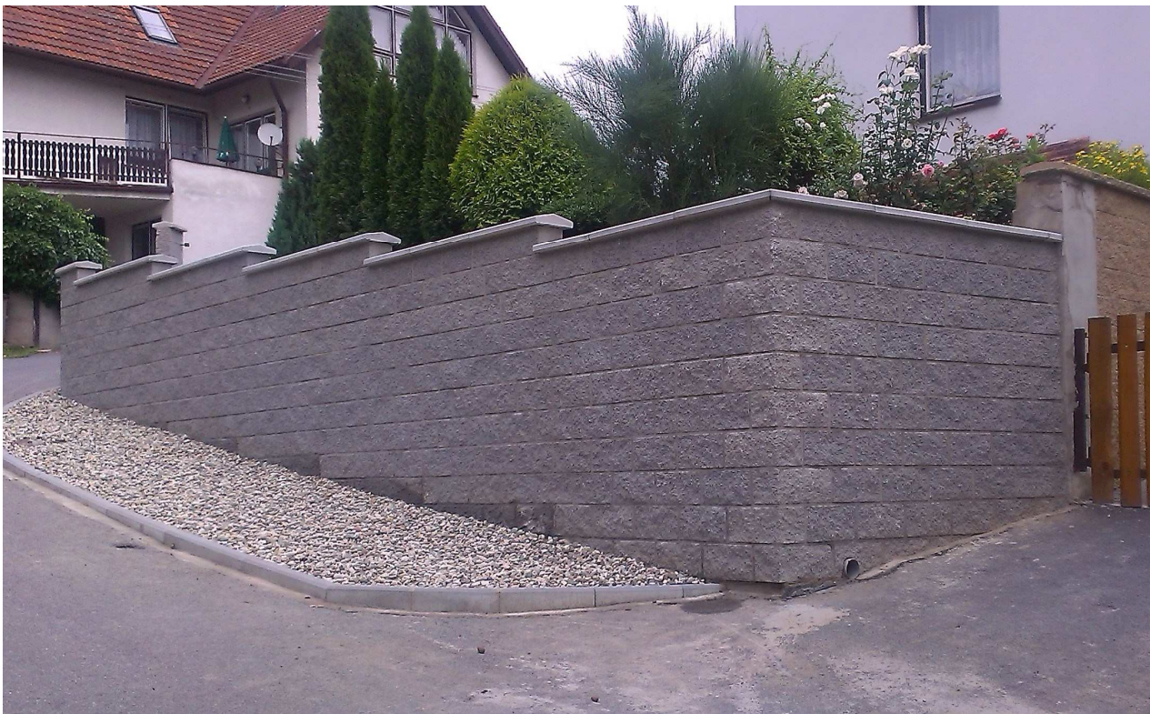
Oprava opěrné zdi ulice Zahradní