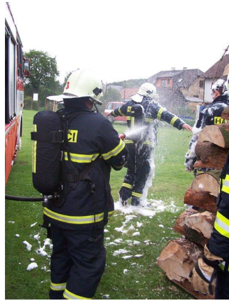
Obr. ▲ Pěna musí dolů – velké koupání