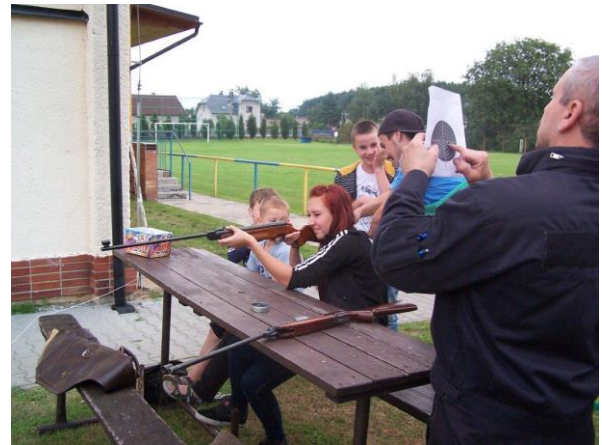
Obr. ▲ Kdo chtěl - střílel