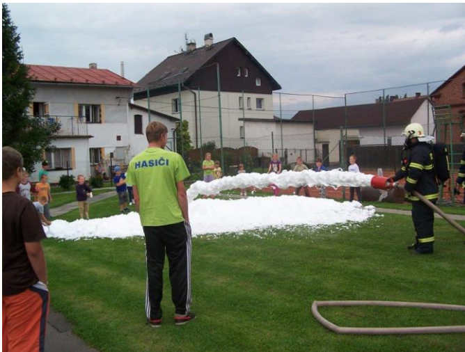
Obr. ▲ Stříkání pěny