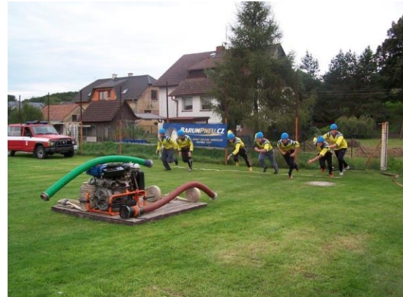
Obr. ▲ Požární útok – hasičská soutěžní disciplína