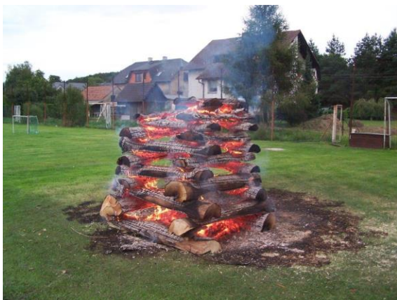
Obr. ▲ Táborák