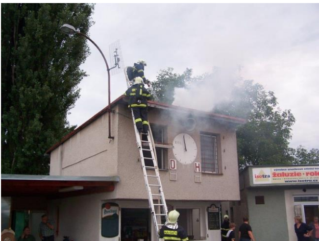
Obr. ▲ Ukázka hašení fingovaného požáru