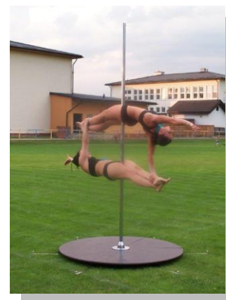
Obr. ◀▲ pool-dance