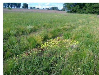
Obr. ▲ I takto se někdo zbavuje zhnízlých jablek v naší obci, i když máme vyhrazené místo

Náš tip: Správnou vlhkost zjistíme, tak že stlačíme hrst kompostovaného materiálu v ruce (materiál z hloubky cca 20 cm pod povrchem). Pokud se po stlačení mezi prsty objeví pár kapek, tak je vše v pořádku (cca 3-4 kapky). Pokud se mezi prsty neobjeví žádná kapka nebo naopak. z ruky teče doslova proud vody, tak kompost následně upravíme podle potřeby.