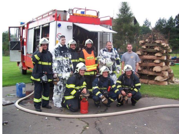
Obr. ▲ Naši hasiči