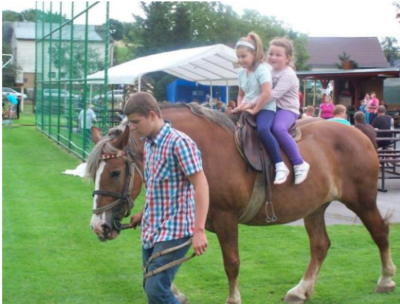
Obr. ▲ Projížďka na koni