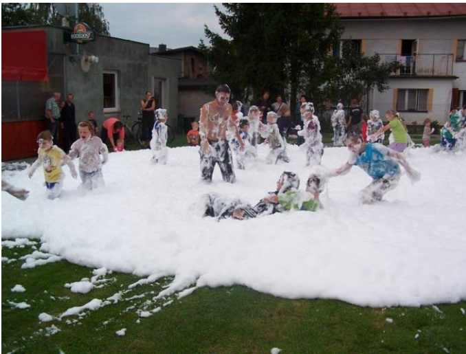
Obr. ▲ Radovánky v pěně