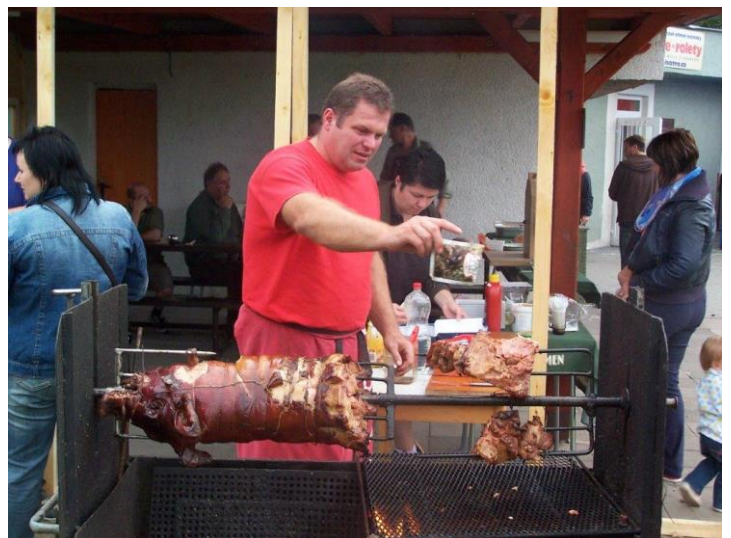
Obr. ▲ Opečené plněné sele, v pozadí se ukrýval srnčí guláš