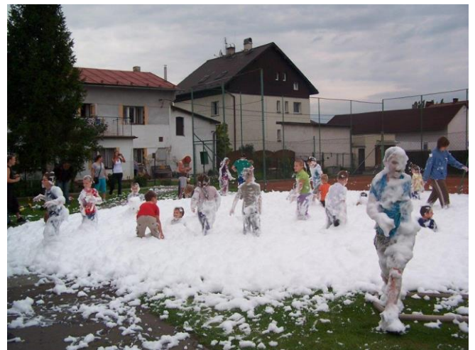
Obr. ▲ Děti byly nadšené