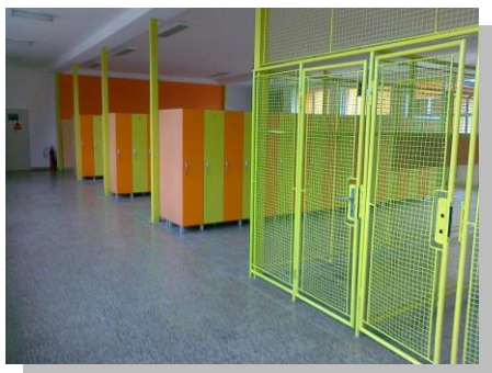
Obr. ▲► Nové šatny

Základní škola v Sudicích zve srdečně všechny rodiče, prarodiče, bývalé absolventy, přátele školy i širokou veřejnost na „DEN OTEVŘENÝCH DVEŘÍ“, který se uskuteční v rámci 40. výročí školy a navazuje na červnovou „ŠKOLNÍ AKADEMII“. Den otevřených dveří se koná v pondělí 1. září 2014 v době od 9 do 18 hodin. A důvodů, proč do sudické školy zavítat, je hned několik. V průběhu dvou měsíců prázdnin se v Sudicích nelenilo, ale pílňě pracovalo, rekonstruovalo. A tak se naše škola může pochlubit nejen zcela novou, moderně zařízenou a vybavenou učebnou fyziky, chemie a přírodopisu, ale také zcela novými šatnami v podobě osobních skříněk našich žáků. Návštěvníci si ale v průběhu takřka celého dne mohou prohlédnout také ostatní prostory školy, mohou nahlédnout do jednotlivých tříd nebo školní družiny. Těšíme se na Vás a děkujeme všem, kteří nás podporují.