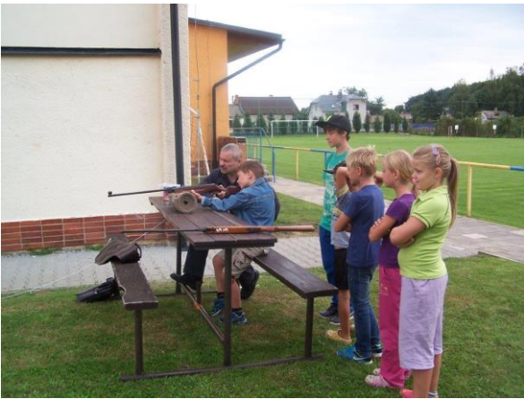
Obr. ▲ Střelba ze vzduchovky