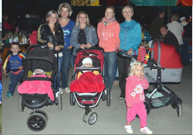
Zahradkářská slavnost 2014