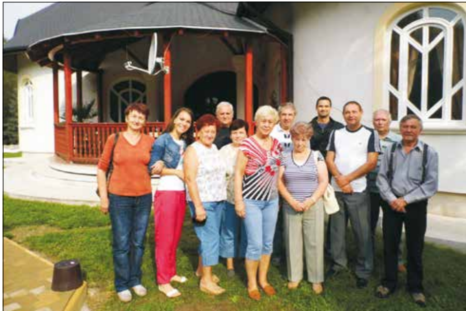
3. zprava v bílém tričku starosta obce Polana

Další den jsme zase jeli autobusem za poznáváním okolí. Navštívili jsme vinařský podnik, kde byla ochutnávka 7 druhů vína s komentářem, procházka provozem a sklepy, kde víno dozrává v sudech. Návštěva hradu a malé keramické dílny, kde si mnozí levně nakoupili