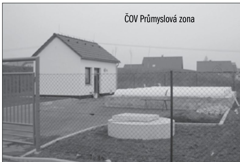
ČOV Průmyslová zona